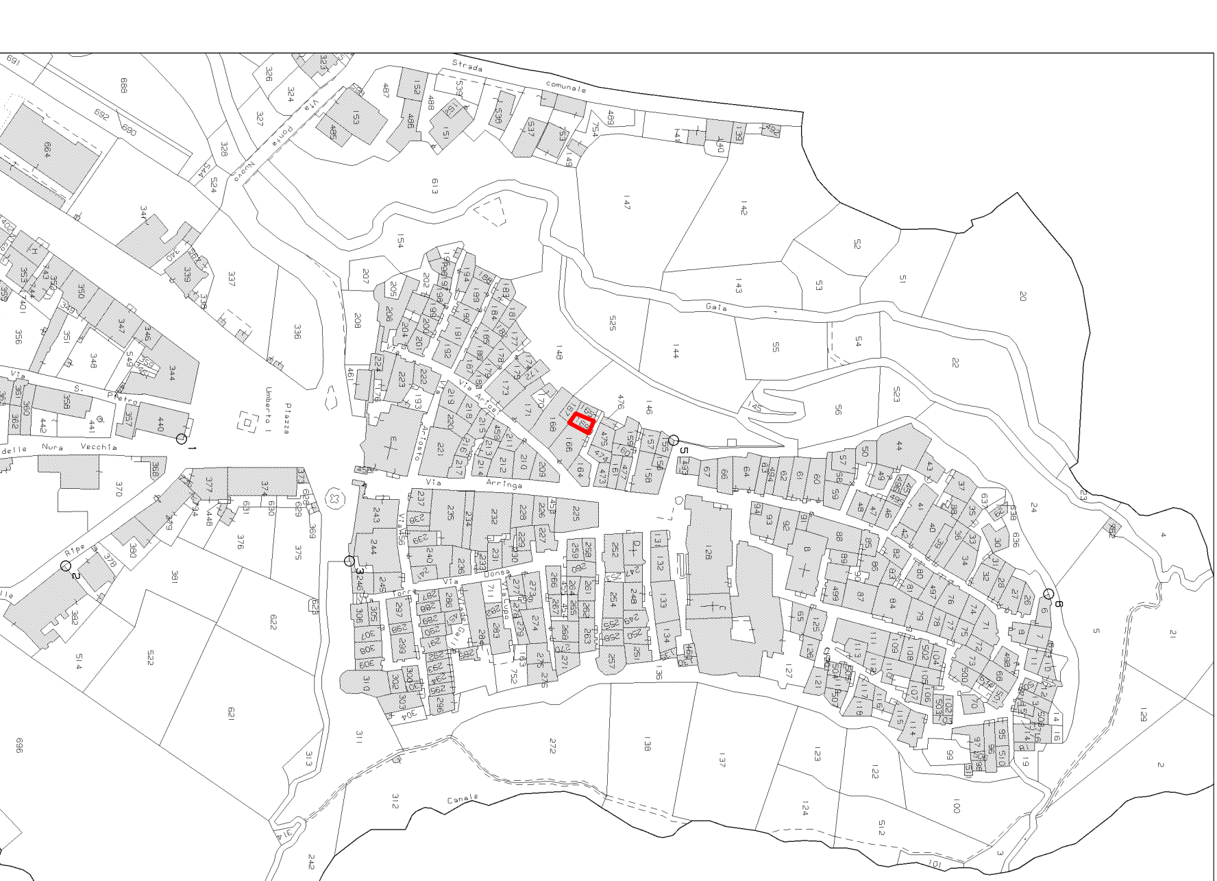
stralci del foglio catastale n. 14 attuale (MFGS) ubicazione immobile oggetto di Esecuzione Immobiliare