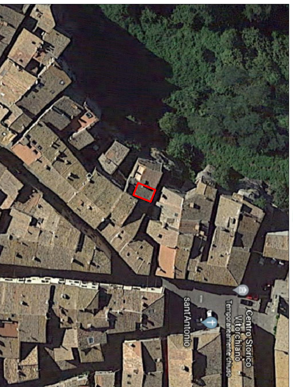
foto aerea generale della zona ubicazione immobile oggetto di Esecuzione Immobiliare

ASSOCIAZIONE I.T.A. S.R.L. - Sede Roma e per casa spec. in opere di architettura Via S. Ruffino, 30 - 01039 VITORCHIANO (VT) Tel. 0765/990901 - 0765/990902 Fax 0765/990903 e Fax. Verde 800013014