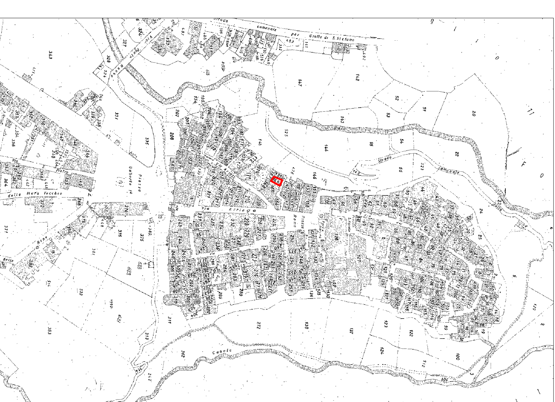
stralci del foglio catastale n. 14 intermedio ubicazione immobile oggetto di Esecuzione Immobiliare